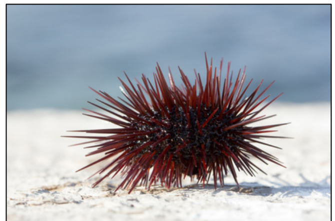
Photographie d'un oursin