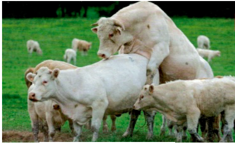
doc 1 : accouplement

Ejaculation : émission de sperme par le pénis du mâle.