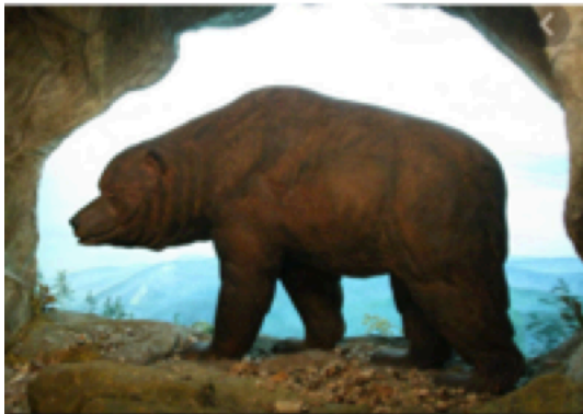
Ours des cavernes