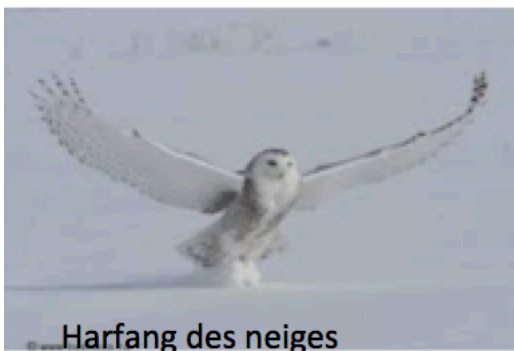
Harfang des neiges