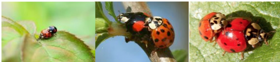
Des accouplements de coccinelles asiatiques